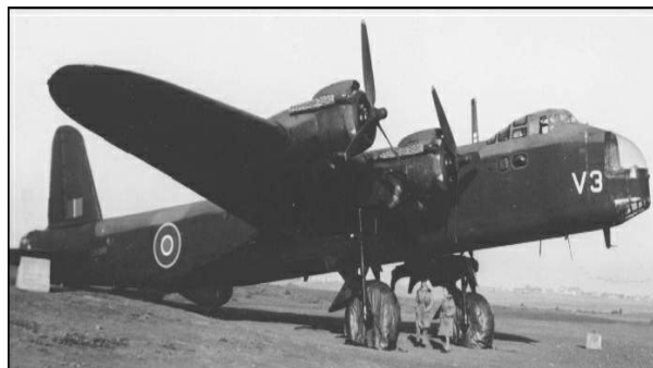
Short Stirling 4 motorige Engelse bommenwerper.

Gegevens van Ger Laugs, oud medewerker van Abdij Lilbosch, met betrekking tot de Short Stirling die op 10 september 1942 op de Landerijen van Abdij Lilbosch is gecrasht. Samengesteld op verzoek van Pejjerlandj.