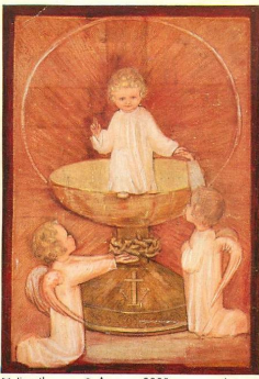
M. Spoel © Ars sacra 3398 eccl. appr.