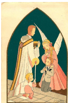
Zonnevande n. v. - Kortrijk B. eccl. appr. 34

29 mei 1960 Ter her. aan je Eerste H. Communie