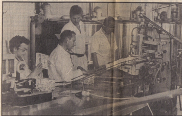
* De ijsproduktie bij Campina-Echt zal tot 't verleden gaan behoren.

„Campina had meteen na de bouwvak kunnen beginnen met enorme financiële steun van het LIOF, omdat GS ondertussen hebben laten blijken dat de vergunning zou afkomen, daar we gezamenlijk al een gesprek hebben gevoerd met de bezwaarden. Nu staan we machteloos na al het werk dat we hebben verzet met steun van het LIOF, GS en de woningvereniging. Ik vraag me af wat de voedingsbonden