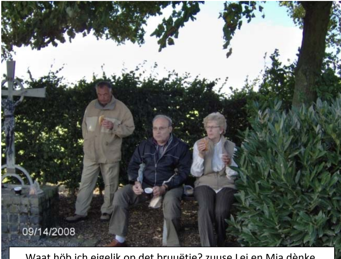
Waat h b ich eigelik op det bruu tje? zuuse Lei en Mia d nke.