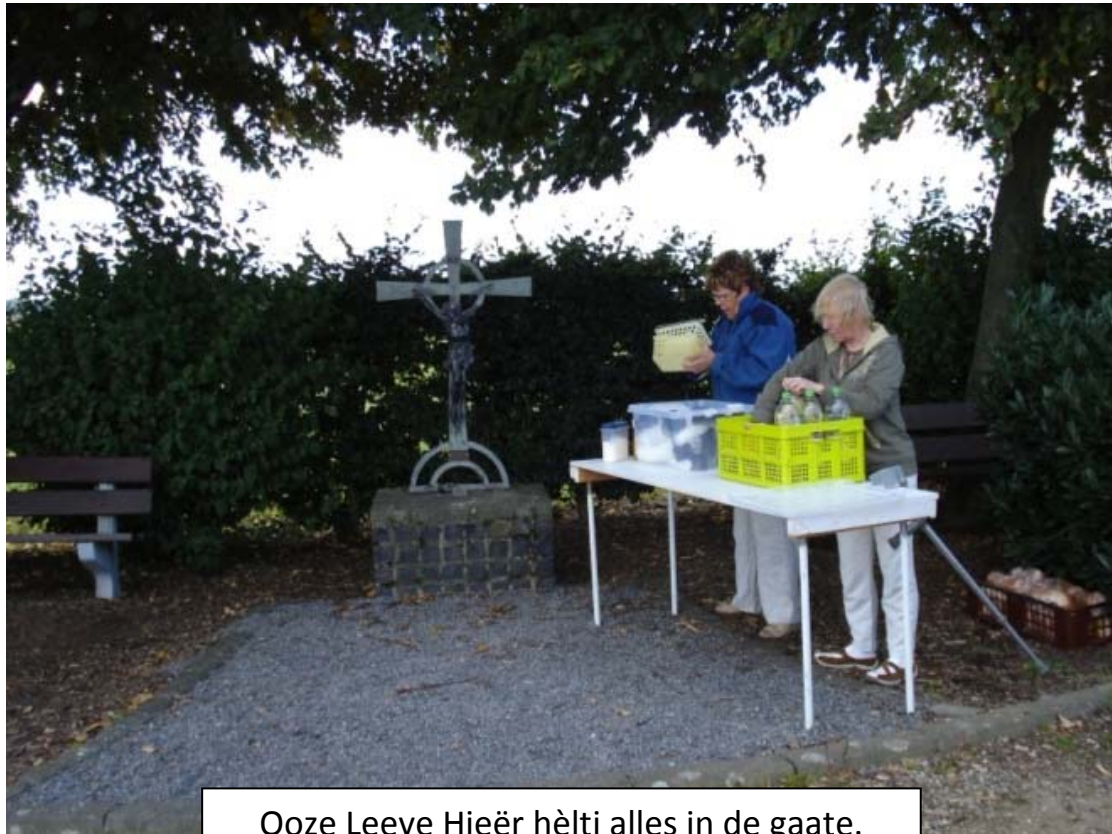
Ooze Leeve Hieër hêltj alles in de gaate.