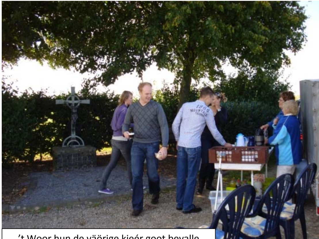
't Woor hun de väärige kieër goot bevalle