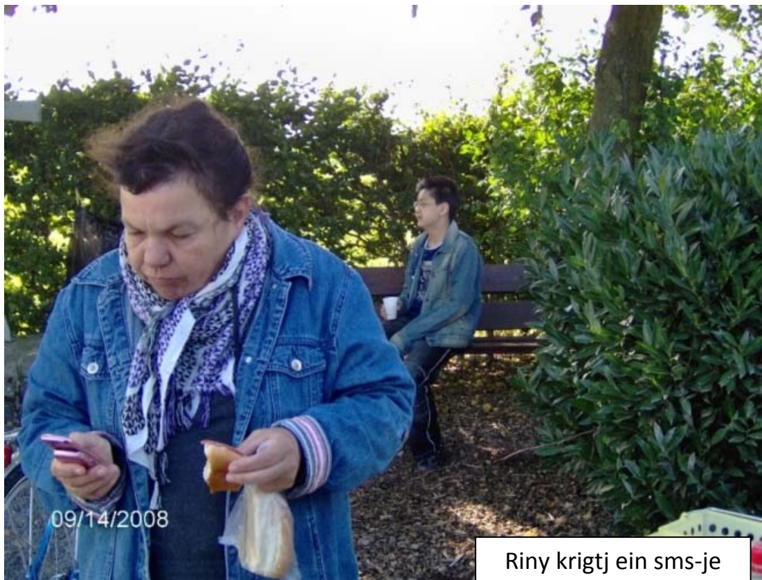
Riny krigtj ein sms-je