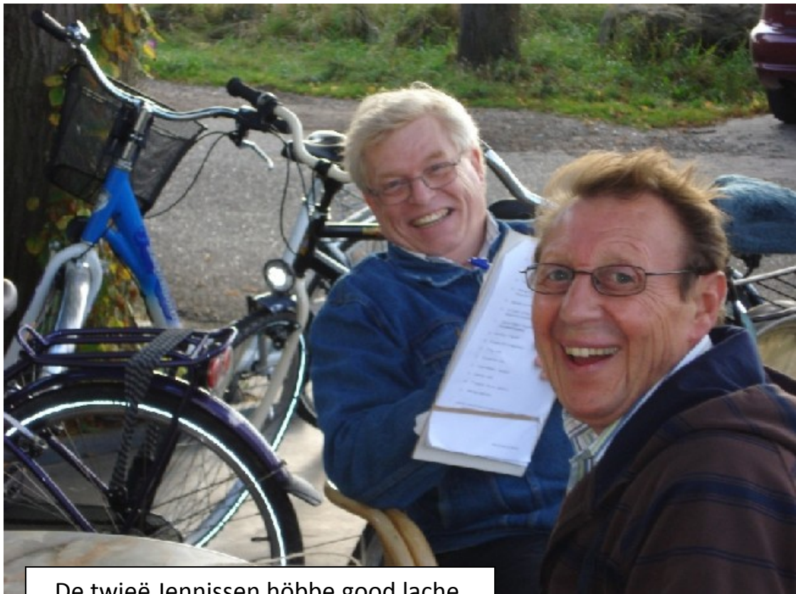
De twee Jennissen hōbbe good lache.