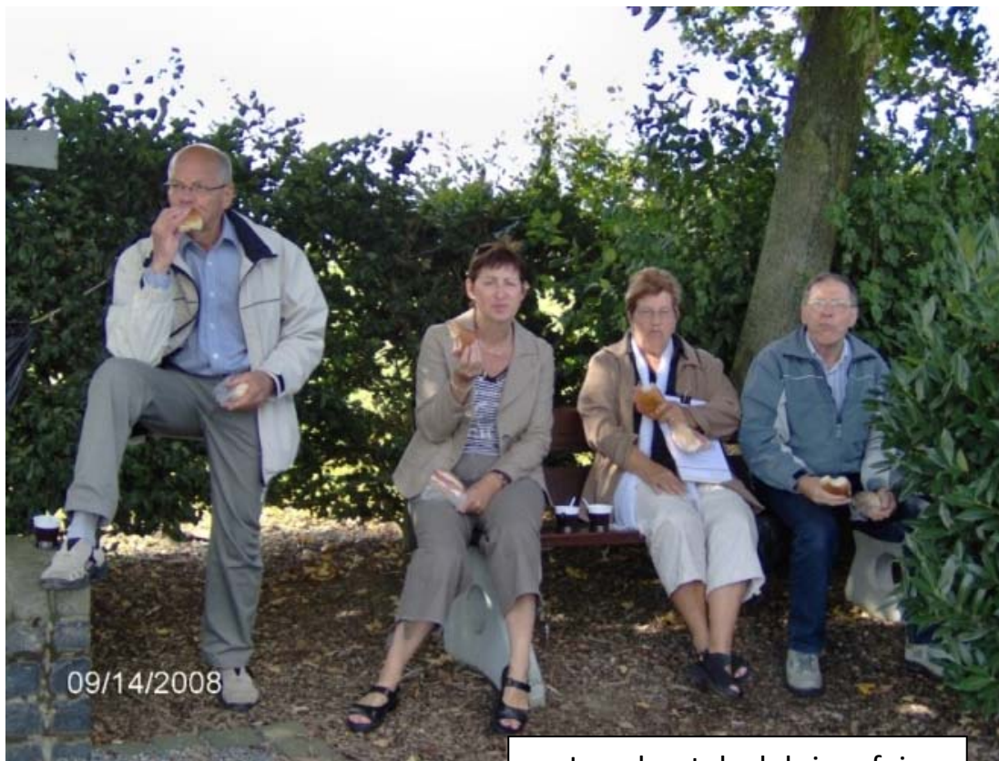
Inne boeteloch krisse fej