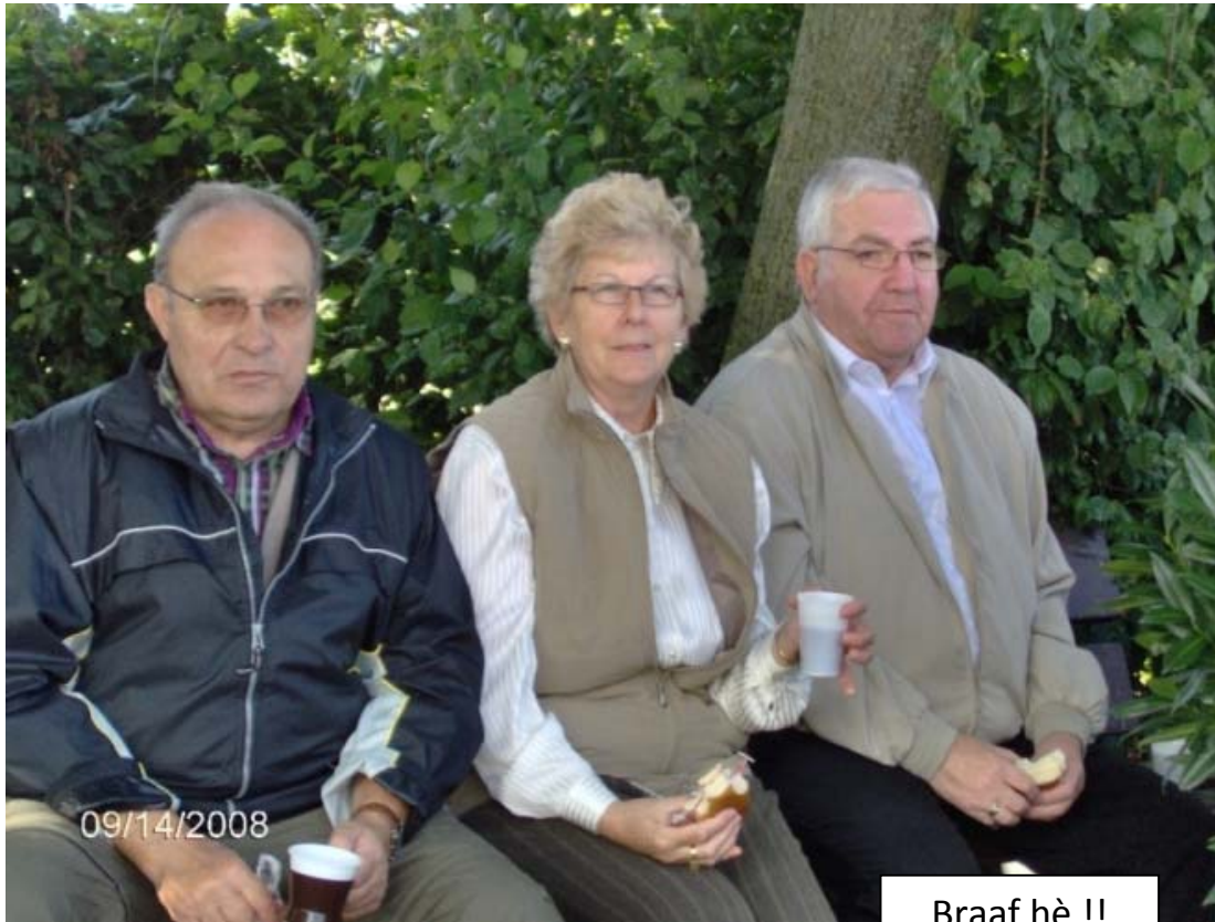
Braaf hè !!