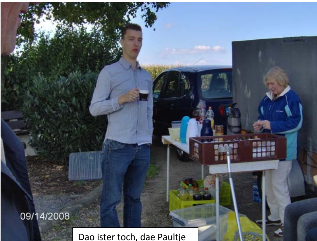
Dao ister toch, dae Paultje