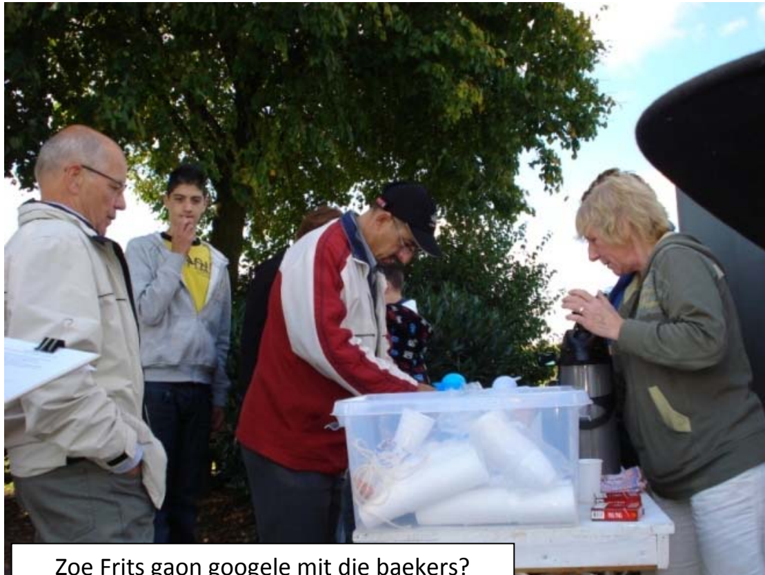
Zoe Frits gaon googele mit die baekers?