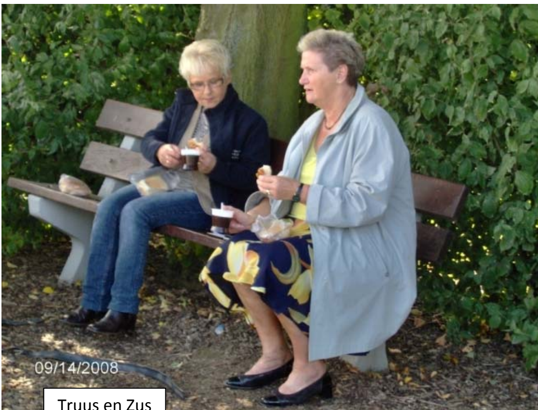
Truus en Zus