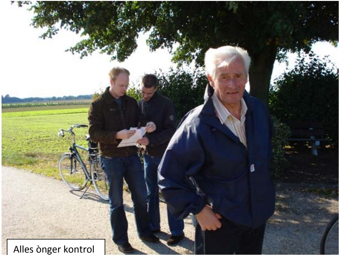
Alles ònger kontrol